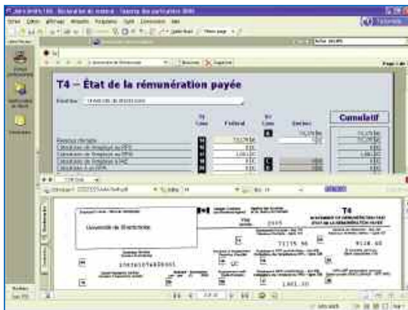
Visualisez les feuillets dans la fenêtre CCH Scan pour établir un lien et faciliter la saisie.

Si vous devez fournir des documents dans le cadre de demandes de révisions post-cotisation, vous pouvez simplement ouvrir la déclaration, afficher le fichier PDF et imprimer les documents afin de les envoyer à l'ARC. Vous n'aurez plus à chercher les copies des feuillets ou à demander aux clients de les trouver!